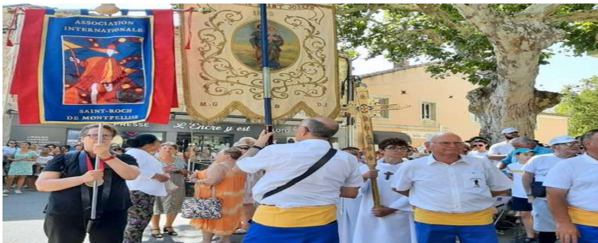
la porte bannière de l'Association Internationale avec la confrérie de Saint-Roch de Rognonas