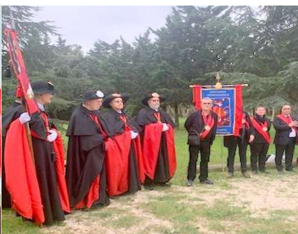
la fraternité Jacquaire de Septimanie et l' AISRM