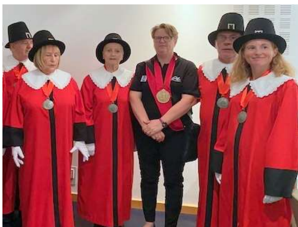
La baronnie de Caravètes

et bien sûr le défilé de la charrette Saint-Roch, le dimanche 18 août à 11 heures, point d'orgue d'un grand cortège conduit par l'Association Internationale Saint-Roch de Montpellier et la Confrérie Saint-Roch de Rognonas avec la participation de très nombreuses confréries, la fraternité Jacquaire de Septimanie conduite par son président, de la baronnie de Caravètes, emblématique de la ville de Montpellier conduite par sa présidente et de très nombreuses autorités civiles internationales, en particulier d'Italie.