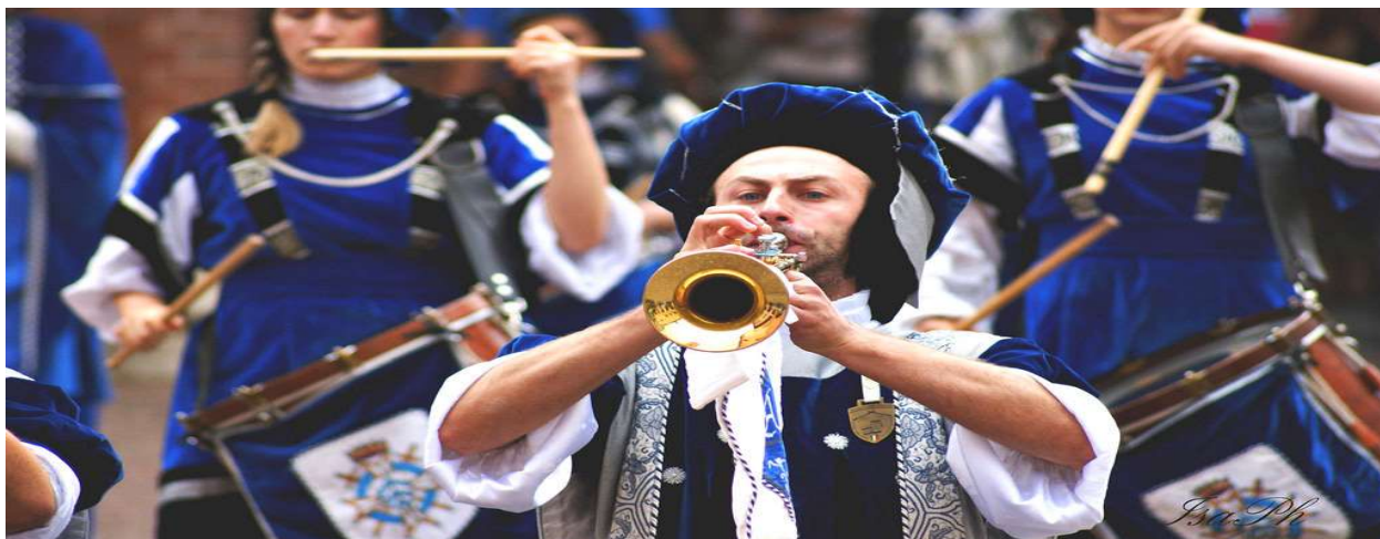
Les musiciens des sbandieratori de San Lorenzo d'Alba liés aux fêtes internationales

Nous avons voulu mettre à l'honneur les centaines de villages en France qui fêtent saint Roch et avons choisi Rognonas pour ces 21eme Rencontres Internationales pour l'exceptionnelle fête qu'elle organise et son défilé de la charrette ornée de buis et des plus beaux fruits et légumes du terroir tirée par une quarantaine de chevaux de traits harnachés à la mode sarrasine.