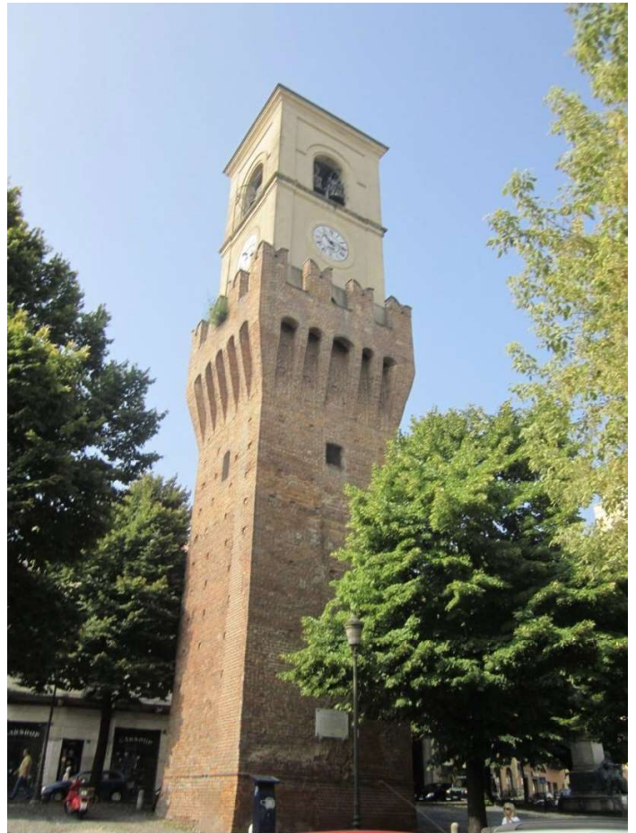
Torre di Stradella

Se recomienda hacer una parada en el Hotel Italia, también equipado para cicloturistas.