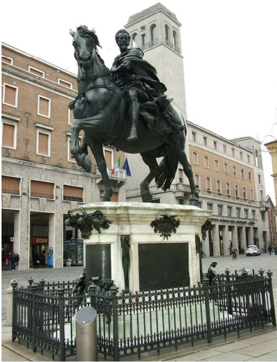
Monumento ad Alessandro Farnese, duca di Parma e Piacenza

The journey begins early in Piacenza at the Church of Sant'Anna on Via Scalabrini, the ancient Church of Santa Maria di Betlem, which features an important painting and a statue of San Rocco. Here, San Rocco stopped and fell ill when he arrived in Piacenza.