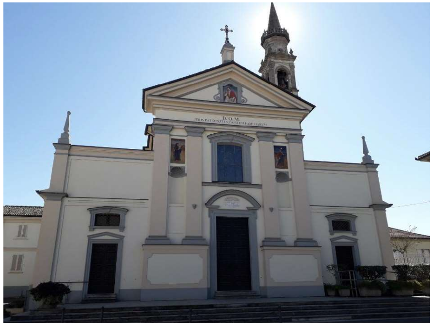
Chiesa di San Carlo Borromeo, Torrazza Coste