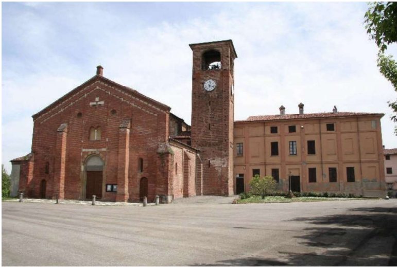
La chiesa di San Giorgio Martire, Arena Po.

The route resumes through fields towards Fontana Pradosa, with the Church of Saints Antonio and Savino, to take Via Spadina which leads directly to Castel San Giovanni.