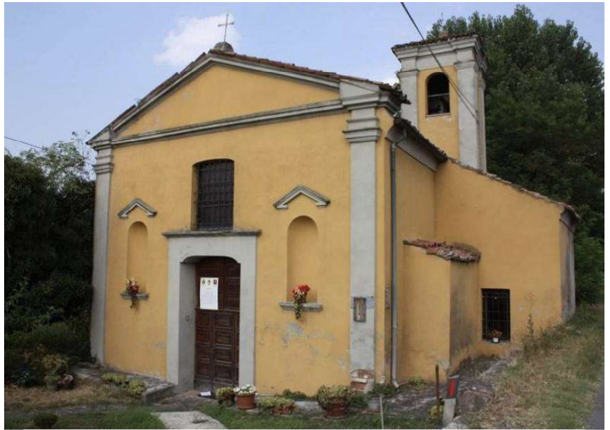
Chiesa San Pietro Apostolo, Pontetidone, Sarmato

Se recorre via Scalabrini y se llega a la grandiosa Basílica de Sant'Antonino, patrón de la ciudad. Después de una breve visita, se procede hasta Largo Battisti. Una mirada al Palazzo Gótico y a los Caballos de bronce de los Farnese para tomar via Garibaldi y